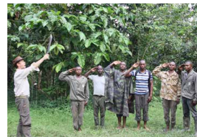
En marcha hacia el 2017!