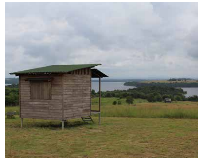
Nueva terraza para la casa y tres nuevos bungalows en la colina