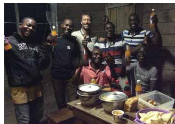
El equipo del triángulo "riega" el nuevo año